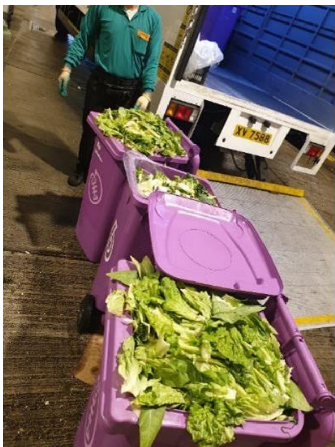
08：領展至今有 50 個物業參與「廚餘收集先導計劃」。