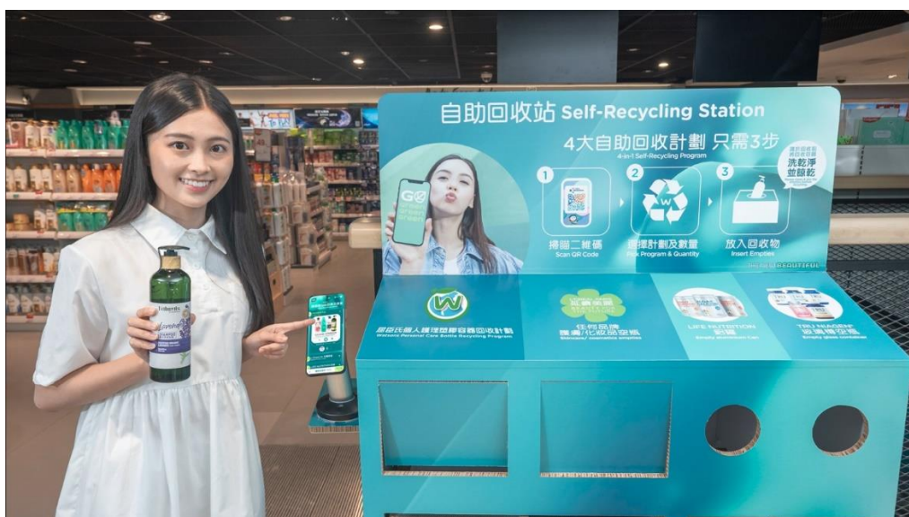
05：屈臣氏是香港第一間保健美容零售商於全港分店推行回收計劃，2015年推行至今已回收逾 80 萬個容器。