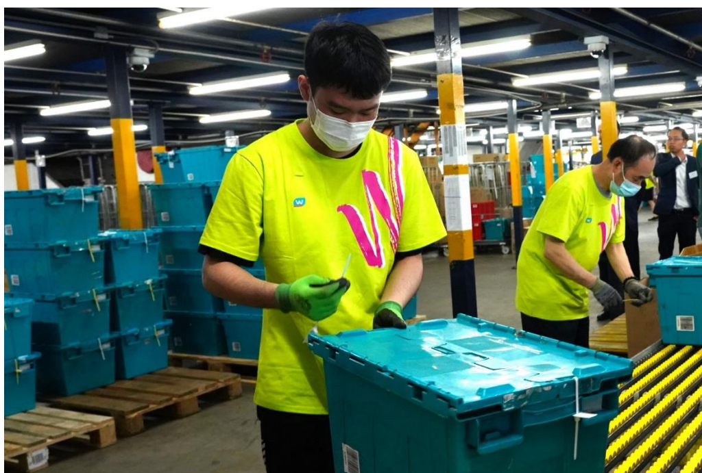
04：屈臣氏線上業務物流中心採用可循環再用的搬運箱送貨。