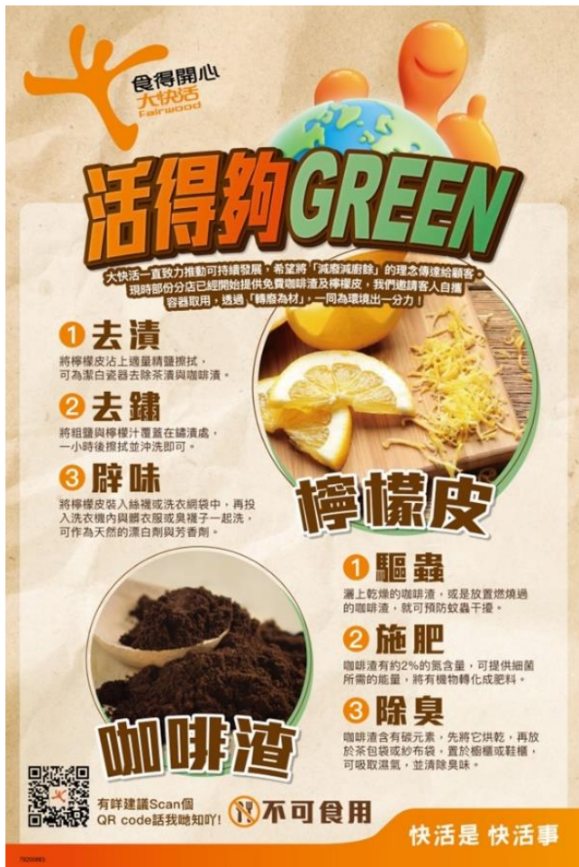
06：大快活全線分店推出了「活得夠 GREEN」活動，免費提供咖啡渣和檸檬皮。