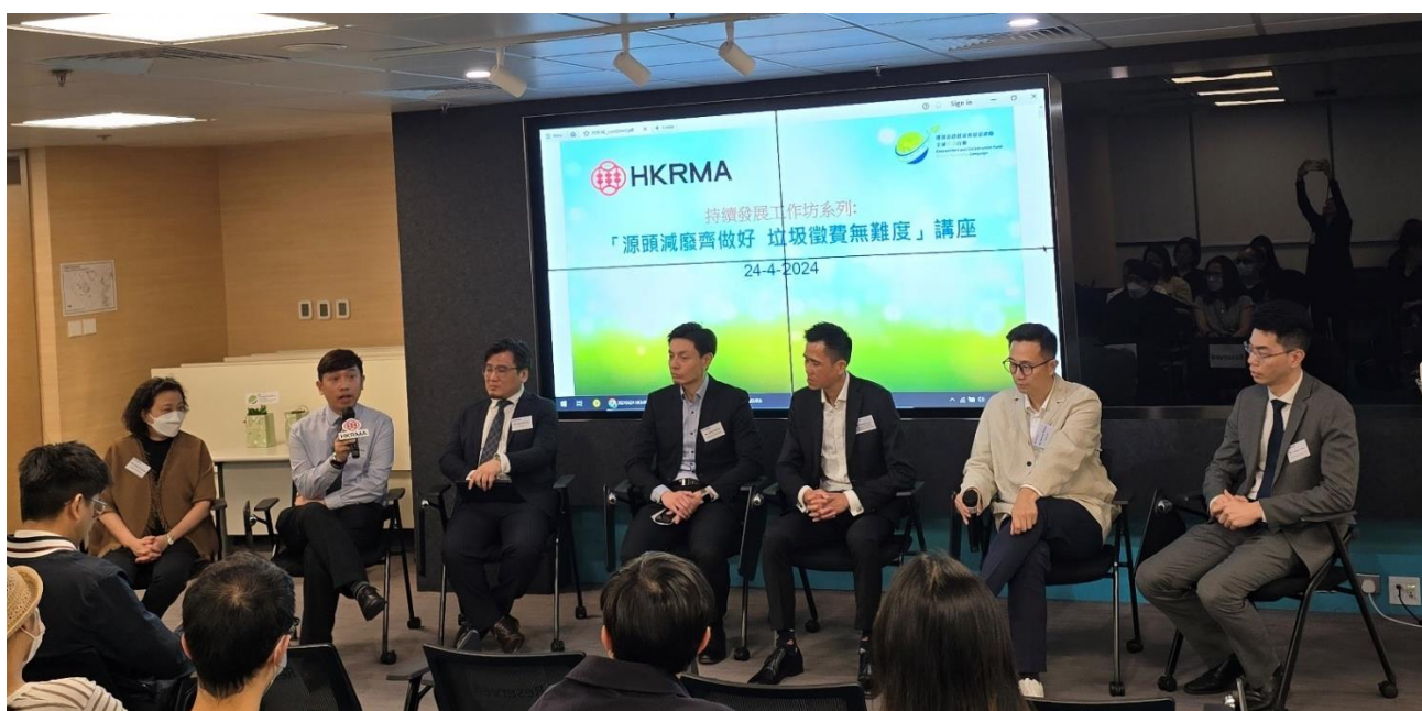
03：講者討論環節中和與會人士分享如何善用資源循環再用經驗。