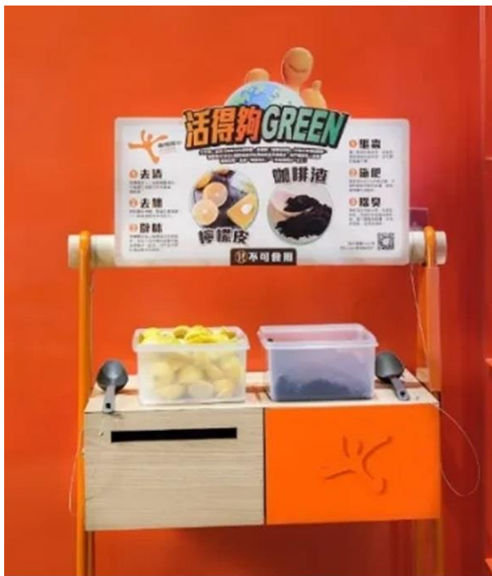
07：活動推行至今已分別免費提供 87 和 33 公噸公咖啡渣和檸檬皮。